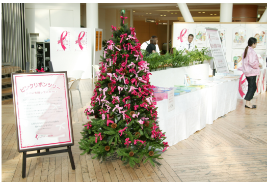
ピンクリボンえひめによる啓発活動風景